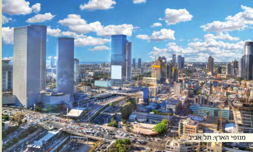
מנופי הארץ: תל אביב

שיטת רשב"י מיועדת ל יחידים כהדרכה ליציאה לגלות (ברכות לה, ב).