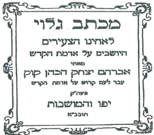
שער הקונטרס שהופץ באדר תרס"ה

(בן-יהודה הביא אותה בשלמותה בעיתון 'השקפה' והקדים לה מספר משפטים "בשביל השורה של דברים כהויתם שהעירה עלי חמת קצת אנשים טובים, שעניתי להם ב"ברור דברים" בגליון מ"ט - בשביל אותה שורה טרח הרה"ג הר"י קוק מיפו ויפרסם אגרת להצעירים בארצנו... הבשביל זה ידינתי הרה"ג מיפו לכף חובה, שאני מודה בפרוש מה שאחרים מסתירים בצביעות פחות או יתר?")