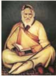
מתורתו של ה'אביר יעקב' - רבנו יעקב אבוחצירא זיע"א