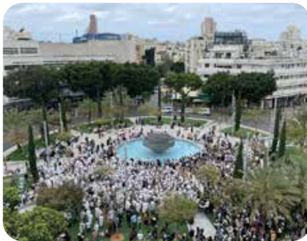
סמל של מאבק על צביון המדינה

בימים אלו ישנו מאבק על זהותה של מדינת ישראל, עיקר גרעין המאבק