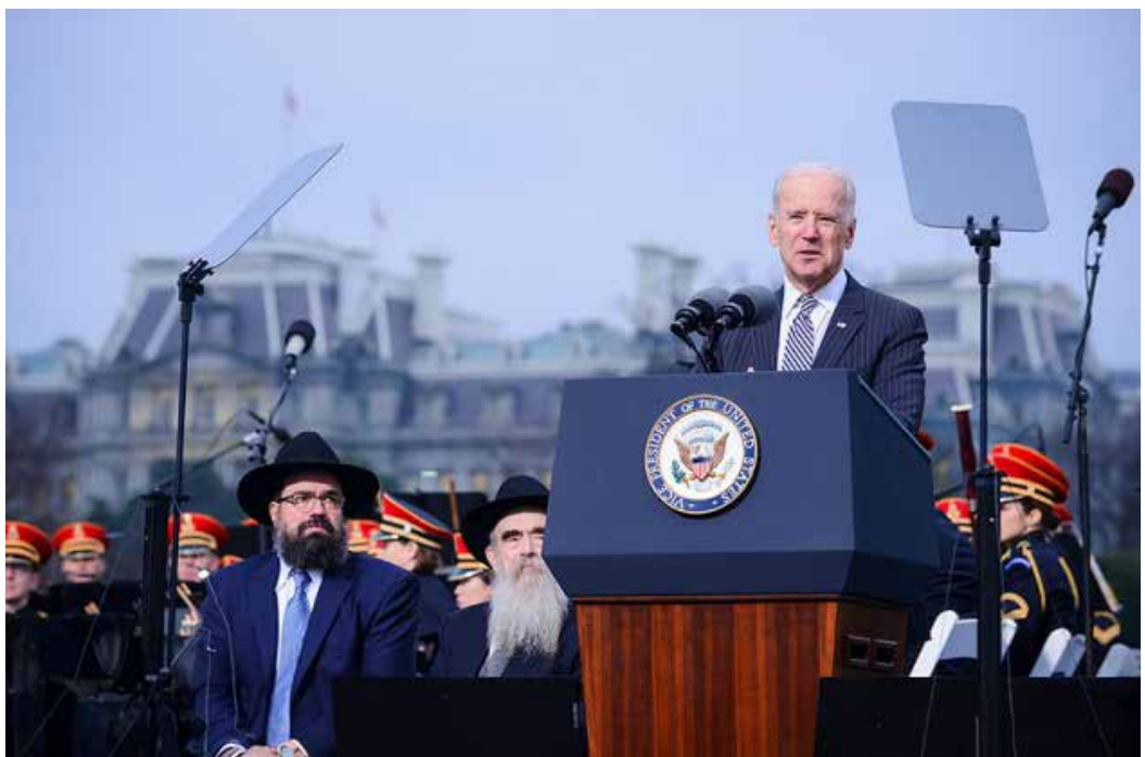
פרסומי ניסא. הנשיא היוצא, ג'ו ביידן, במעמד הדלקת החנוכייה הלאומית כשלצדו הרבנים השליחים למשפחת שם־טוב.

"בעיניי, בימינו אלה, נתח משמעותי מהאוכלוסייה הערבית והמוסלמית בעולם מבין שאין לעם היהודי דבר נגדו, והצדדים יכולים לחיות בשלום זה עם זה ללא מלחמה די בקלות. לאורך השנים צפיתי בכאב כיצד ממשלת ישראל נקלעת שוב ושוב לווייתורים מפליגים שלא הביאו את התוצאות שהובטחו, בלשון המעטה, וכפי שהזהיר הרבי מראש - הם עלולים רק להביא לעוד ועוד אסונות, רחמנא ליצלן. אני חושב שהתוצאה הכי טובה שיכולה להיות לשני הצדדים, היא להביא לשלום על בסיס משותף כמו הסכמי אברהם המטיבים לכל הצדדים". בעניין הזה, רומז הרב שם־טוב, יש עוד תוכניות חיוביות: "שמעתי שיהיו דברים טובים, אבל אין הברכה שרויה אלא בדבר הסמוי מן