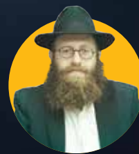
תניא - כלים מעשיים לחיים הרב אמחיה אבן ישראל